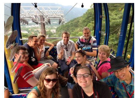
(2016年6月コスタリカ。世界各国から100名が集合。前方左から2番目の忍者が私)