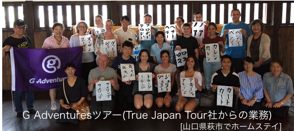
G Adventuresツアー(True Japan Tour社からの業務) [山口県萩市でホームステイ]